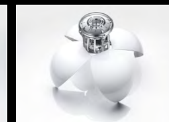
ORB WHITE OPENED