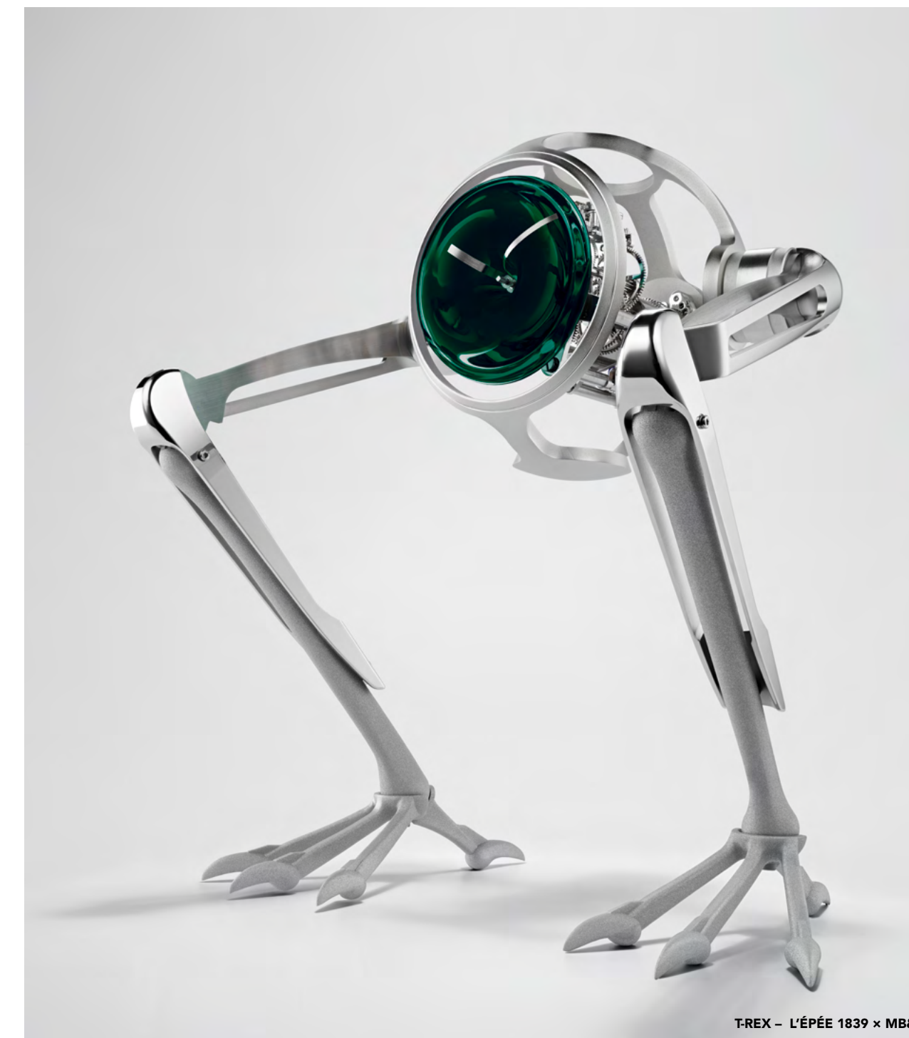
T-REX – L'ÉPÉE 1839 x MB&F