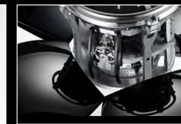
ORB BLACK CLOSE-UP