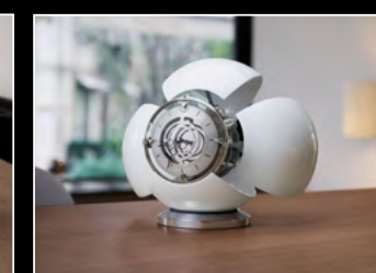
ORB WHITE LIFESTYLE