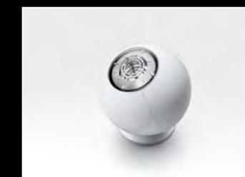
ORB WHITE CLOSED