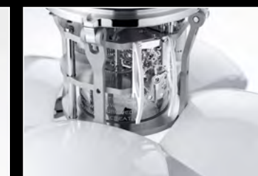
ORB WHITE CLOSE-UP