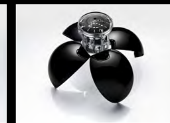
ORB BLACK OPENED