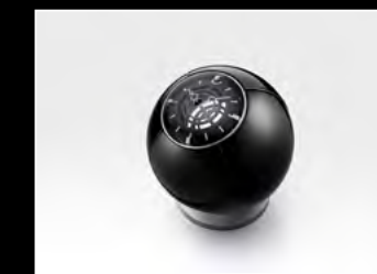
ORB BLACK CLOSED