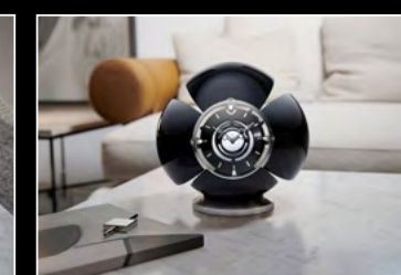
ORB BLACK LIFESTYLE