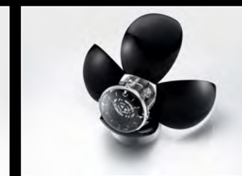
ORB BLACK SEMI-OPENED