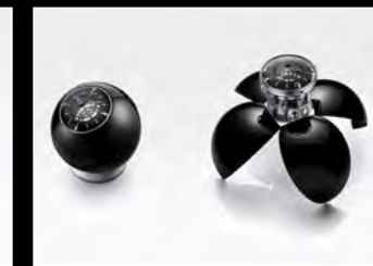
ORB BLACK DUO