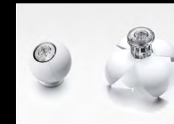
ORB WHITE DUO