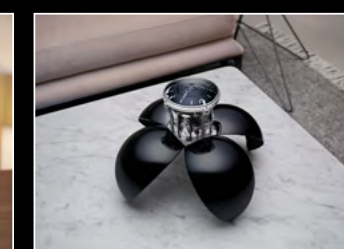
ORB BLACK LIFESTYLE