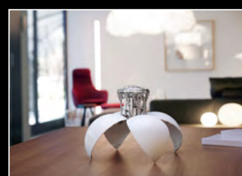
ORB BLACK LIFESTYLE