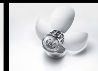
ORB WHITE SEMI-OPENED