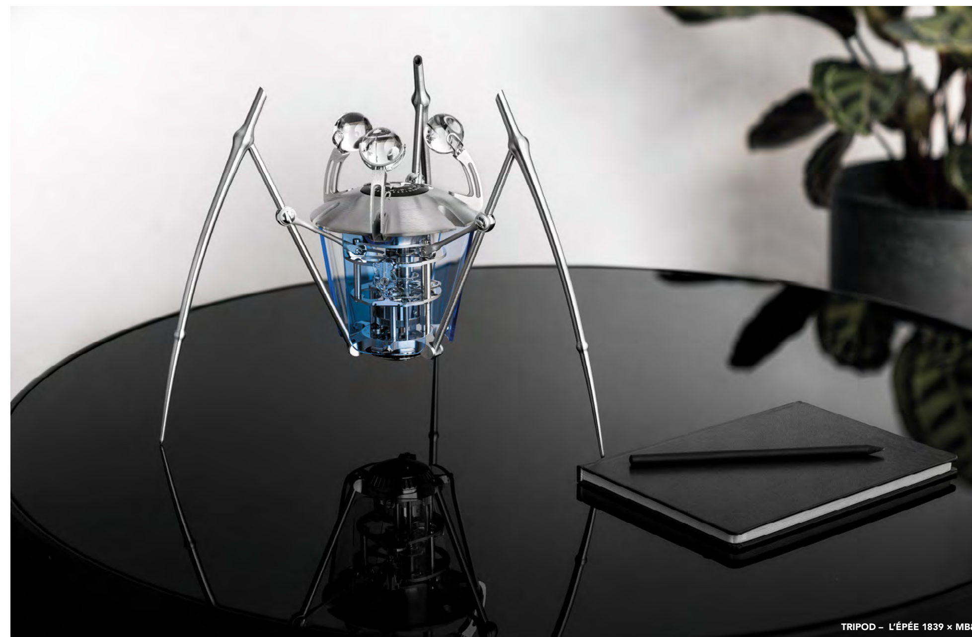
TRIPOD – L'ÉPÉE 1839 x MB&F

PARA MAYOR INFORMACIÓN POR FAVOR CONTACTE A: CHARRIS YADIGAROGLOU CY@MBANDF.COM ARNAUD LEGERET ARL@MBANDF.COM MB&F / GENEVA, SWITZERLAND TEL: +41 22 508 10 38