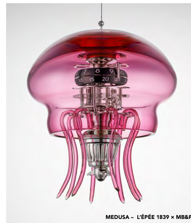
MEDUSA – L'ÉPÉE 1839 x MB&F