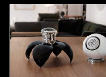
ORB DUO LIFESTYLE