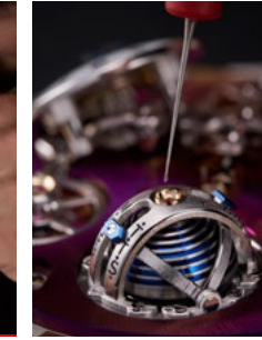
M.A.D House Workshops