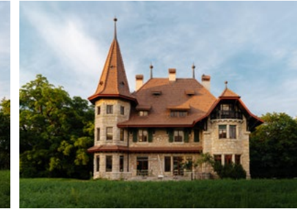
M.A.D House Exterior view