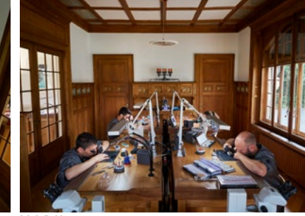
M.A.D House Workshops