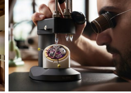
M.A.D House Workshops