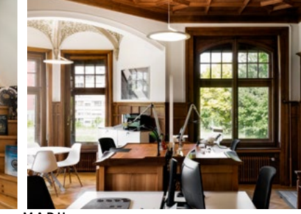
M.A.D House Interior view