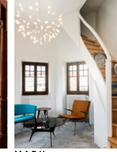
M.A.D House Interior view