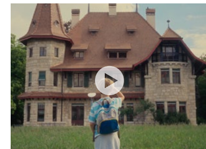
M.A.D House Movie