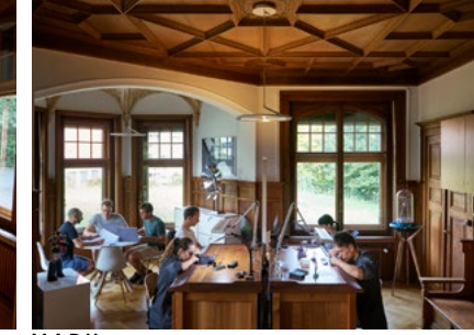
M.A.D House Workshops