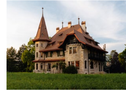
M.A.D House Exterior view

انقر هنا للوصول إلى النشرة الصحفية بلغات أخرى، وأيضاً للوصول إلى كل صور المنتج (بدقة منخفضة وعالية)