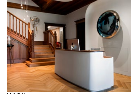
M.A.D House Interior view