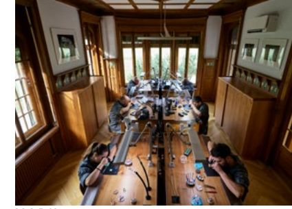
M.A.D House Workshops