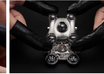
M.A.D House Workshops