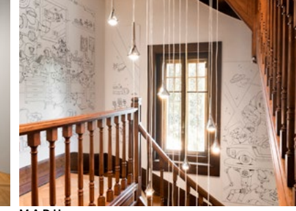
M.A.D House Interior view