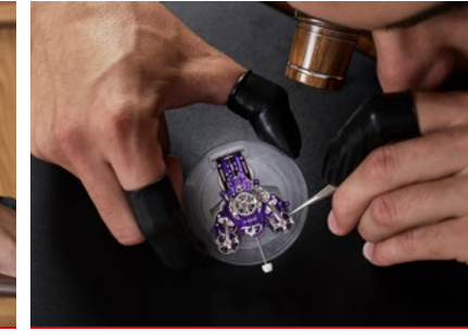
M.A.D House Workshops