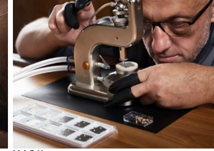
M.A.D House Workshops