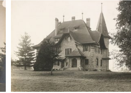
M.A.D House Villa Copplier, 1907