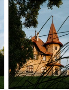
M.A.D House Exterior view