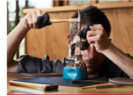
M.A.D House Workshops