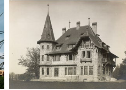
M.A.D House Villa Copplier, 1907