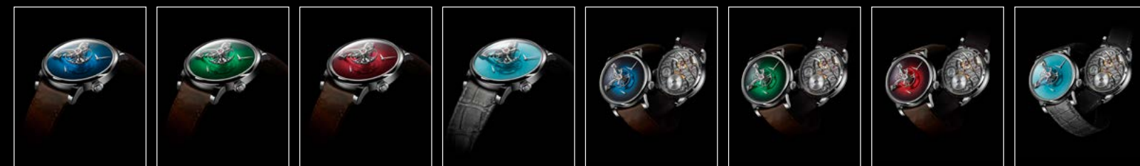
LM101 MB&F x MOSER BLUE PROFILE LM101 MB&F x MOSER GREEN PROFILE LM101 MB&F x MOSER RED PROFILE LM101 MB&F x MOSER SEDDIGI PROFILE LM101 MB&F x MOSER BLUE RECTO/VERSO LM101 MB&F x MOSER GREEN RECTO/VERSO LM101 MB&F x MOSER RED RECTO/VERSO LM101 MB&F x MOSER SEDDIGI RECTO/VERSO