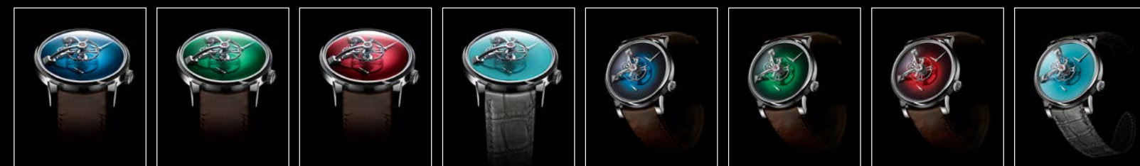
LM101 MB&F x MOSER BLUE FACE LM101 MB&F x MOSER GREEN FACE LM101 MB&F x MOSER RED FACE LM101 MB&F x MOSER SEDDIGI FACE LM101 MB&F x MOSER BLUE FRONT LM101 MB&F x MOSER GREEN FRONT LM101 MB&F x MOSER RED FRONT LM101 MB&F x MOSER SEDDIGI FRONT