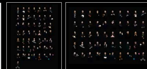
LM101 MB&F x MOSER FRIENDS PORTRAIT LM101 MB&F x MOSER FRIENDS LANDSCAPE