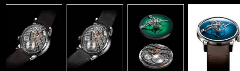
LM101 MB&F x MOSER BACK LM101 MB&F x MOSER SEDDIGI BACK LM101 MB&F x MOSER ENGINE LM101 MB&F x MOSER FACE WHITE