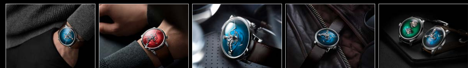
LM101 MB&F x MOSER WRISTSHOT BLUE LM101 MB&F x MOSER WRISTSHOT RED LM101 MB&F x MOSER LIFESTYLE 01 LM101 MB&F x MOSER LIFESTYLE 02 MB&F x H. MOSER LIFESTYLE